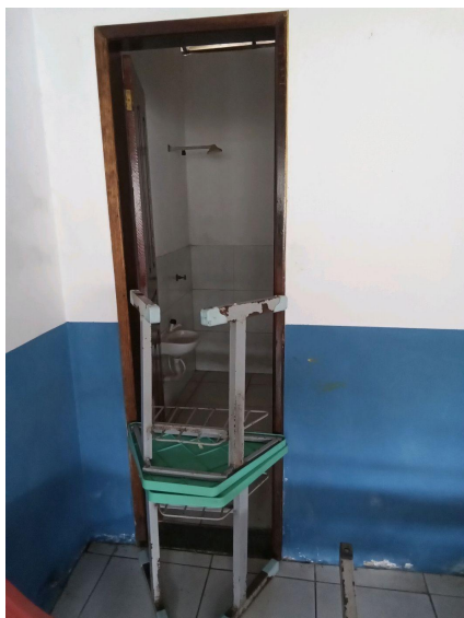
Banheiro masculino interditado

Comentários: O banheiro masculino não está funcionando.