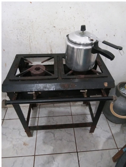
Fogão parcialmente funcionando

Comentários: Somente uma das bocas do fogão está funcionando.