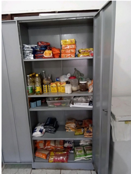
Armário onde são guardados alimentos não perecíveis

F.3.1) Nas paredes da despensa foram observadas inadequações aparentes?