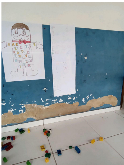
Paredes do pátio

G.3) A ESCOLA VISITADA dispõe de outras instalações esportivas ?