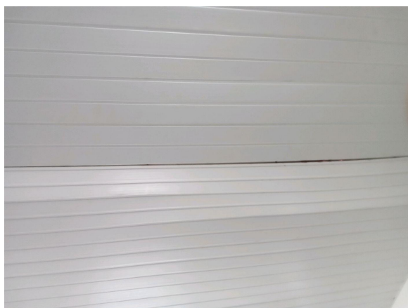
Forro do teto da cozinha

F.2.4) Nos pisos da cozinha, foram observadas inadequações aparentes?