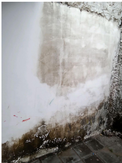
parede na entrada da escola