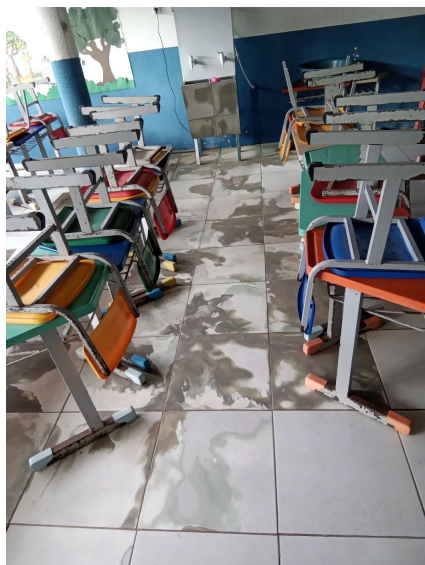
Piso do refeitório

Piso em péssimo estado, apresentado infiltração Refeitório fica localizado ao lado dos banheiros