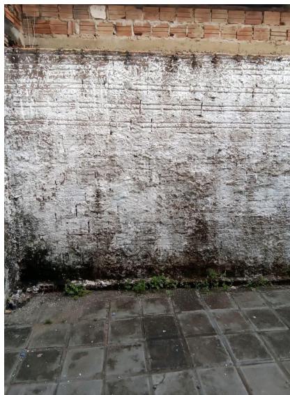
Parede lateral da entrada da escola

C.3) Nas coberturas da entrada foram observadas inadequações aparentes?