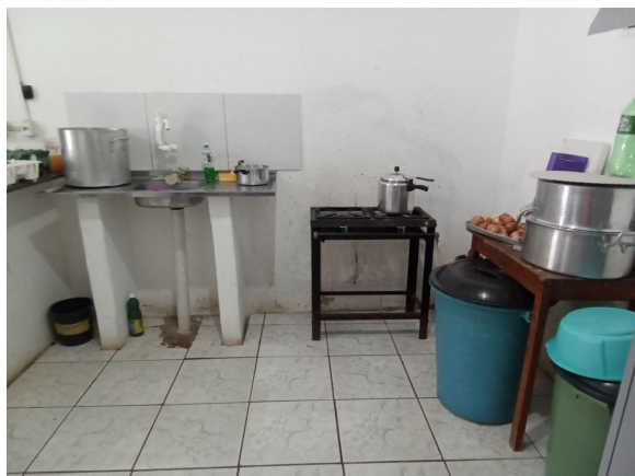
Paredes sem revestimento