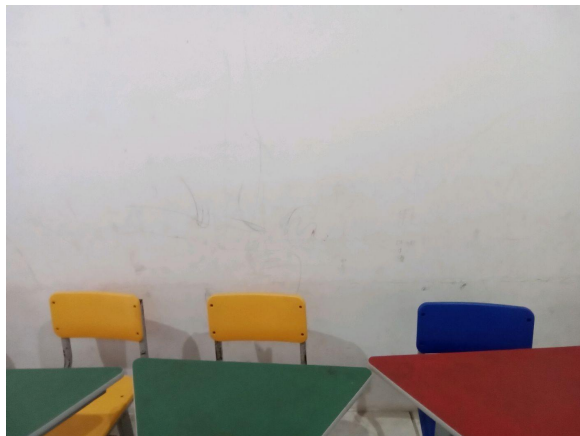
paredes da sala de aula

Comentários: Paredes sujas e rabiscadas.