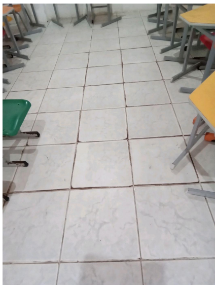
Piso da sala de aula

C.21) As instalações das salas de aula estão adaptadas - PNE?